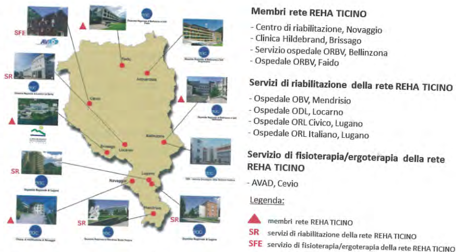
Fig. 1: La rete riabilitativa REHA TICINO